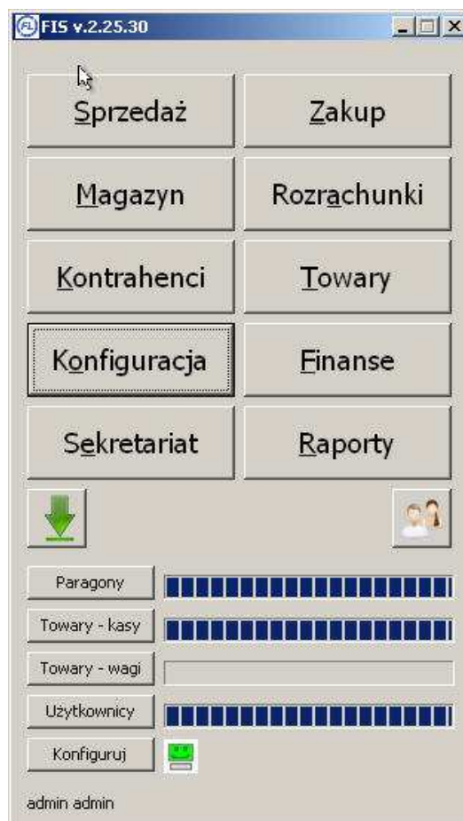
Formatka główne okno systemu FIS

FIS to łatwy w obsłudze program, który posiada wszystkie niezbędne moduły ułatwiające funkcjonowanie przedsiębiorstwa takie jak: